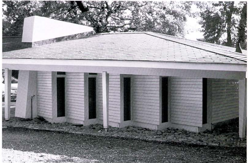
Vue du nord