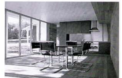
Grande salle avec cuisine